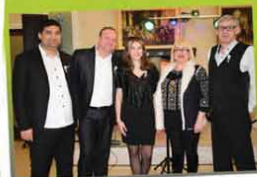
FORMAȚIA FLOARE DE COLȚ