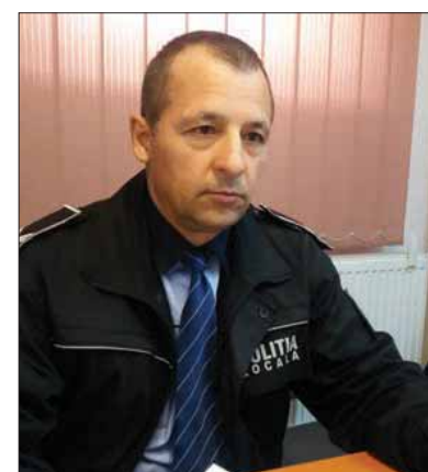
cu avertisment. Conform HCL 236/2017, Anexa 1, Pct.8, astfel de fapte sunt sancționate cu amendă de la 100 la 500 lei.

Chiar zilele trecute, agenții Poliției Locale au surprins un cetățean, pe strada Cornești din sat Valea Adâncă, care a ieși cu căruța de pe câmp direct pe stradă, fără a curăța roțile, lăsând în urma sa urme groase de pământ. Persoana în cauză a fost întoarsă din drum de agenții prezenți la fața locului și a fost pusă să curețe asfaltul imediat. Pentru că a reacționat prompt și a înțeles faptul că a greșit, acesta a fost sancționat doar