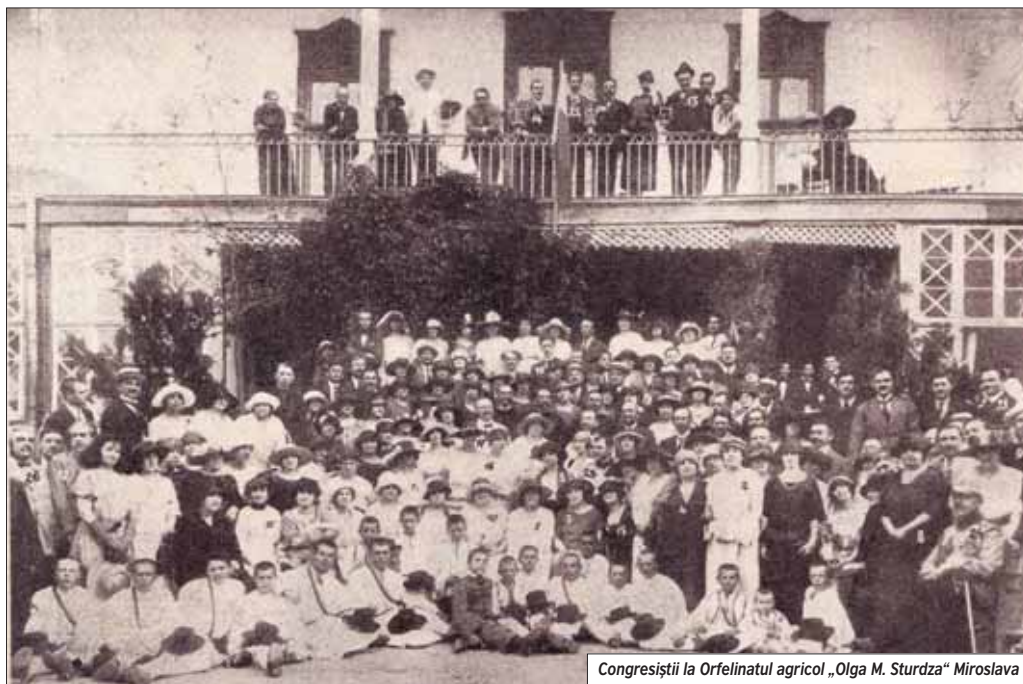
Congresiștii la Orfelinatul agricol „Olga M. Sturdza“ Miroslava

Autoritățile române au constatat după circa trei luni de la declanșarea operațiunilor militare, că numai în Moldova existau circa 40 de mii de orfani. Încă din iarna 1916-1917 prin activitatea comitetu-