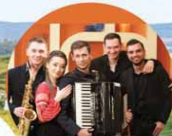
TARAFUL LĂUTĂRESC DIN CHIȘINĂU