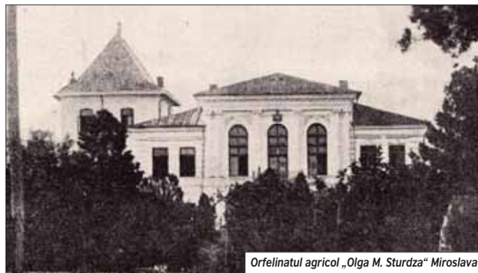
Orfelinatul agricol „Olga M. Sturdza“ Miroslava

Practic la sfârșitul anului 1920 se organizează pe întregul teritoriul țării, în baza principiului descentralizării, pentru toate provinciile și în toate județele. „Societatea pentru ocrotirea orfanilor de război“ care a beneficiat în același timp de susținerea materială și de activitate a numeroase persoane particulare dar și de concursul direct a instituțiilor statului care recunoșteau ofi-