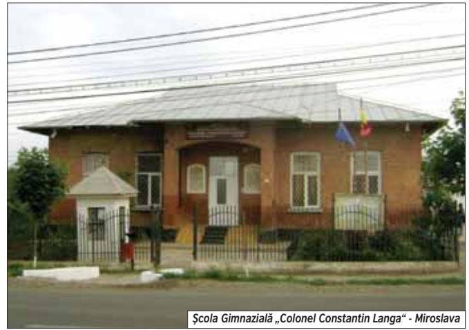
Școla Gimnazială „Colonel Constantin Langa” - Miroslava