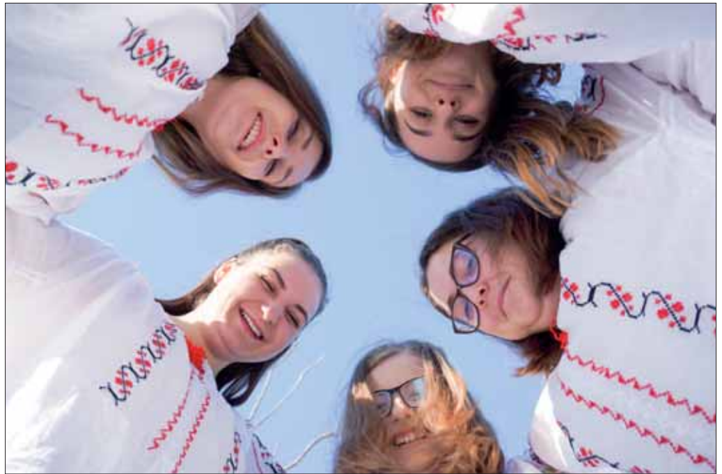
Fete din satul Balciu, ianuarie 2019

Lețcani până în cartierul Dacia. Din punct de vedere pedologic, era considerat un pământ bun, că era și platou. Și se cerea să facem 5.000 de kilograme de boabe de porumb. Păi terenul ăla băltea de apă și nu se reușea nimic cu el! După Revoluție s-a retrocedat terenul care a fost la Cooperativa Agricolă de Producție din Miroslava și... cam asta a fost. C.A.P.-urile care și-au păstrat forma merg bine și acum. Agricultură modernă nu se poate face cu pământuri fărâmițate. Aici nu este vorba de politică, ci de știința agriculturii. Puseseră niște foșoare pe câmp, ca la pușcărie, la granițe. Să vadă dacă vreun țăran fură păpușoi“.