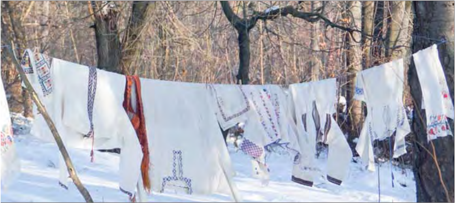
Vechile costume tradiționale, scoase la aerisit

Habar nu aveam acum vreo 50 de ani de calorifere, centrală și altele. Uite că am. Și am scăpat să fac focul cu cioate. Acum e de trăit în sat“.