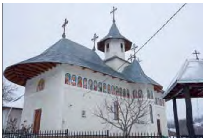
Biserica din Balciu (exterior)

„Dacă înainte de 1989 erau vremuri potrivnice credinței ortodoxe și bisericii, după 1990 au venit și altfel de provocări. Secte care încearcă și, în unele cazuri, reușesc - din cauza sărăciei ori a convingerilor slabe ale unor oameni - să îi atragă în astfel de organizații. În câteva