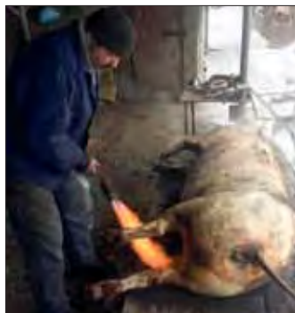
Tarani din Balciu sacrificand un porc. Ianuarie 2019

Tânără este obișnuită cu munca. Odimioară, la 17 ani, multe fete erau și măritate. Acum nu mai e cazul. Sunt alte vremuri. Munca însă este aceeași pentru țaran. După căderea comunismului, țărani s-au întors înapoi la sapa de lemn