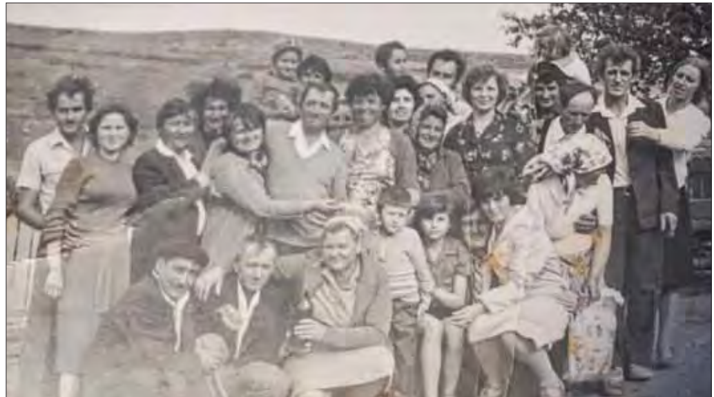
O nuntă în sat înainte de 1989