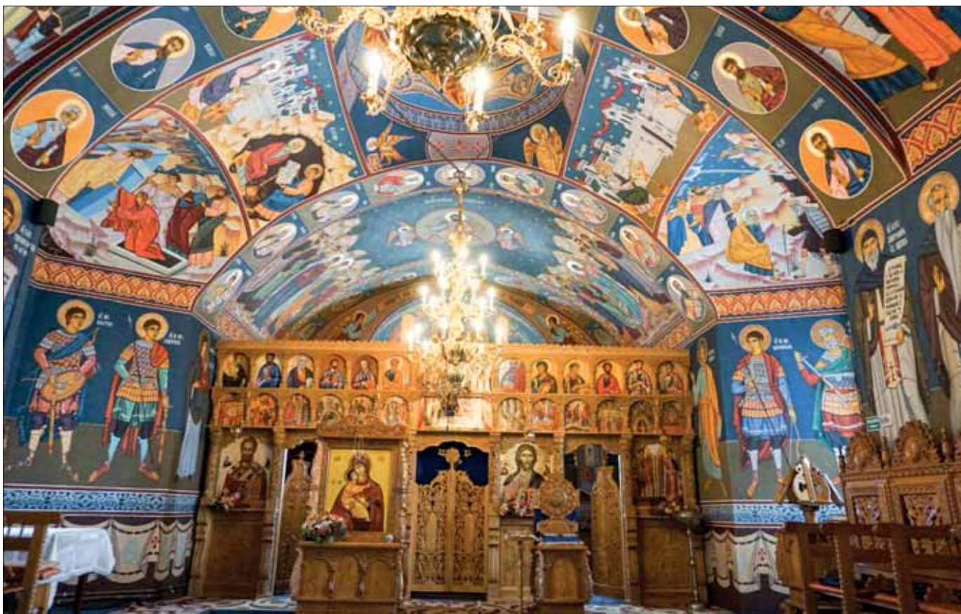
Interiorul bisericii „Sf. Arhangheli Mihail și Gavriil” din satul Balciu