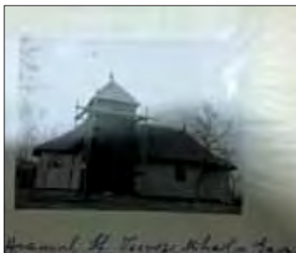
Vechea biserică de lemn din sat

Din cele mai vechi timpuri, Biserica Ortodoxă a avut un rol important pentru noi. Biserica a fost inima satului. Pe lângă biserică au apărut primele școli. Căsătoriile, nașterile, înmormântările se înregistrau la biserică. Nu existau primării. Ele au apărut târziu în istoria noastră milenară, iar biserică a fost cea mai importantă instituție.