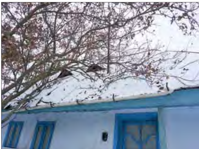
Cea mai veche casă din sat are un secol

În documentele istorice îl regăsim sub denumirea Balciul. Este atestat istoric încă din anul 1446. Domn al Moldovei era Ștefan al II-lea. El a domnit între 1 august 1442 - 13 iulie 1447. Denumirea satului o regăsim și la pârâul care este afluent al Nicolinei. Satul se întindea pe valea situată între dealurile Nucul și Balciul. Așadar regăsim și aici denumirea.