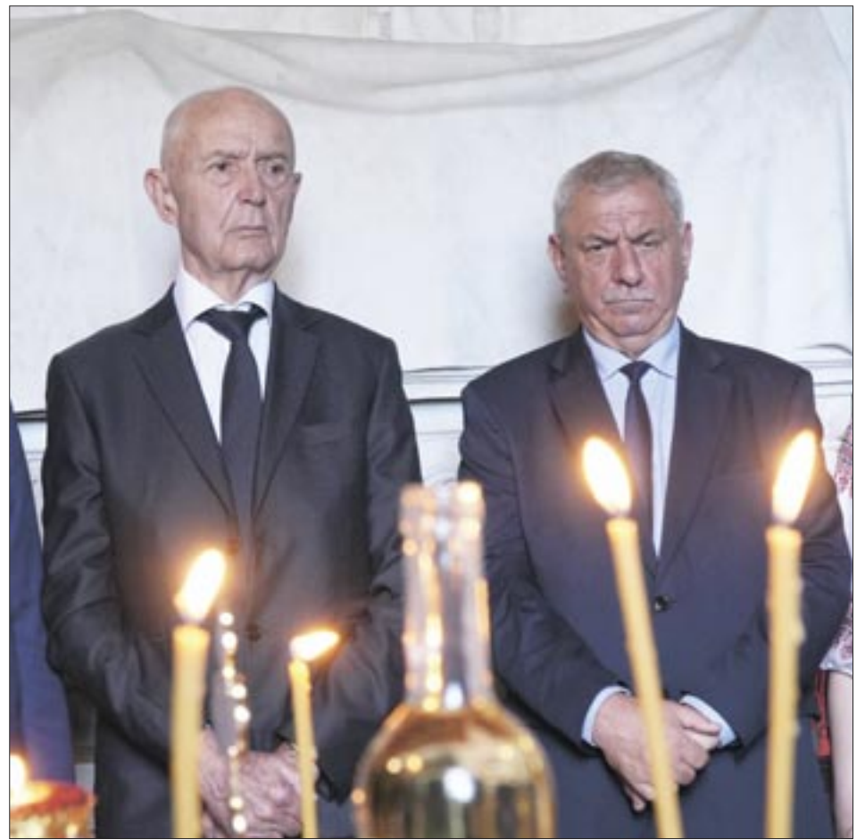
trarea memoriei principesei, denumirea mând ca de acum înainte, liceul din Miroslava să-i poată purta numele.”